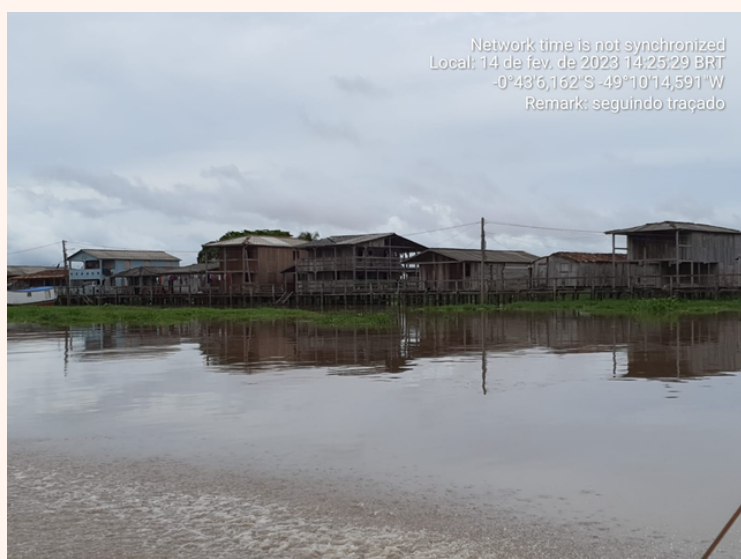
ILHA DO MARAJÓ

Construir na Ilha do Marajó é de uma complexidade ímpar, alojamentos em barcos, transportes em balsas, áreas alagadas e acessos por rios e braços d'água. O sucesso será o produto de uma equipe forte, unida e disposta a superar as dificuldades sejam elas construtivas ou impostas pela natureza.